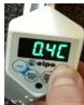
Zwiększanie temperatury wyświetlanej